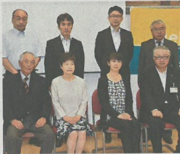
助成金を受けた各団体の 代表者

向陽中などに助成金 マークスHD育英会 マークスホールディング ス育英会は23日、本県、宮