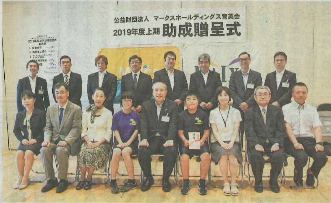
助成を受けた各団体の代表者ら

公益財団法人マークスホールディングス育英会（仙台市、米谷春夫代表理事）は28日、青少年の教育やスポーツ振興を目的に県内外の9団体に助成金167万円を贈った。