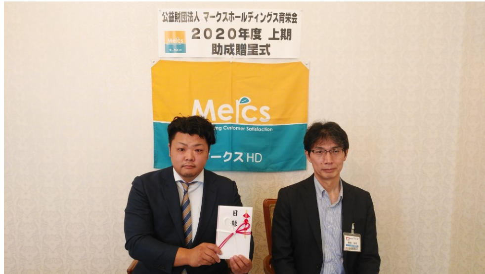
② BIGWESTBASEBALLCUP 実行委員会